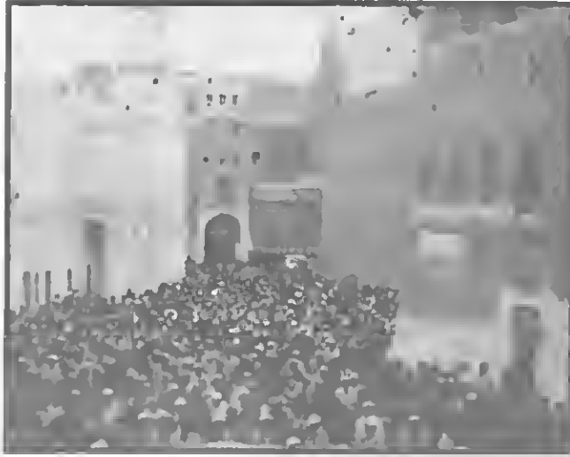
حَوْلُ الحبيب علي الحبشي وتظهر ساحة الرياض بها منزله والمسجد والرباط الذي أسسهما الحبيب علي